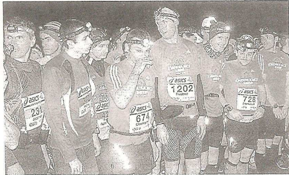
Les coureurs sont partis avec la lampe frontale pour la nocturne des 20 km.