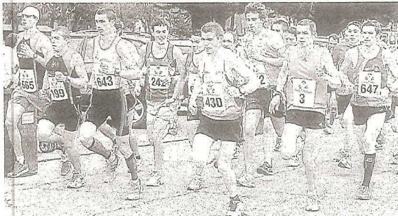
Moins d'inscrits que l'an passé, mais le niveau était plus relevé.