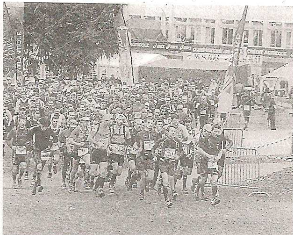
1 697 athlètes classés sur les trois distances de l'épreuve : le trail du Vignoble nantais est devenu en peu de temps, un must de la spécialité.

En grandissime favori, le champion en question n'a guère mérogé sur les 51,2 km d'un parcours qualifié de « roulant et agréable » par les purs trailers. Dans la course reine, il lui a fallu 5 km