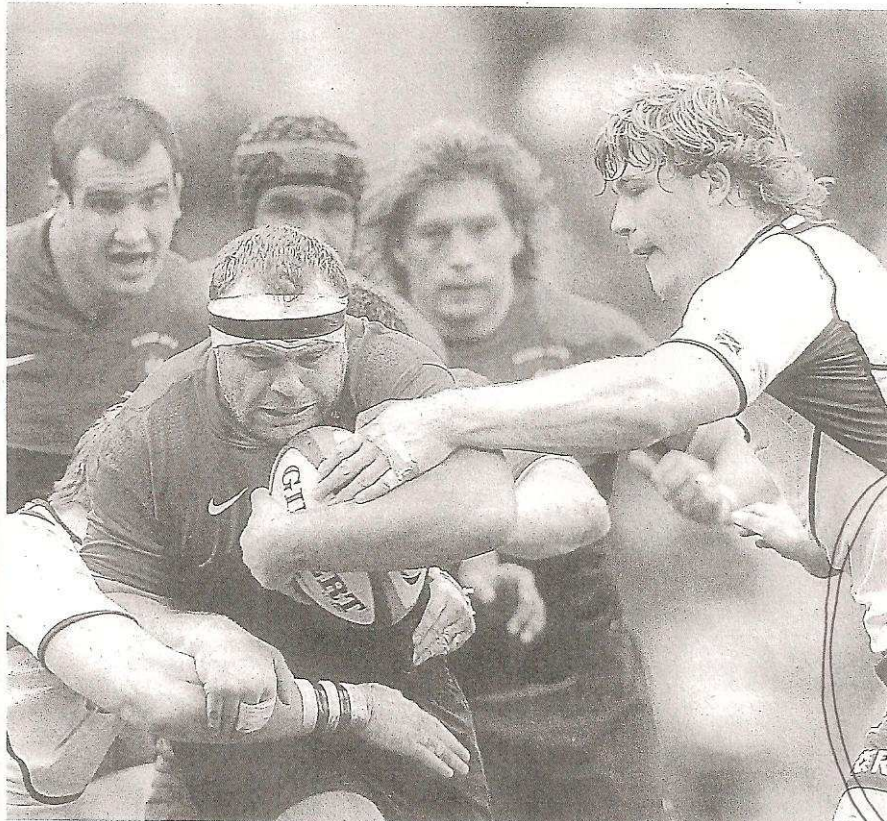
Le XV de France a dû batailler ferme pour venir à bout de l'Ecosse, hier, à Edimbourg (23-17).

Football Rennes arrache le nul face à Lille (1-1)