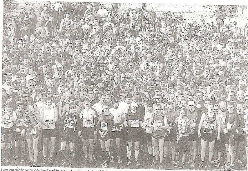
Les participants étaient prêts pour le départ des 20 km, avec quelques minutes de retard, le balisage étant endommagé par des jeunes qui participaient à une rave party.

Ce dernier, a encore une fois réussi le Défi Fondu : il est arrivé le premier, après avoir couru la course nocturne et les 50 km, ce qui lui fait au total 71 km 900 en 5 h 21 mn. Une performance réalisée avec 20 minutes