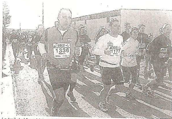
Le trail du Vignoble nantais a attiré participants et spectateurs, sur les routes et à travers la vigne.