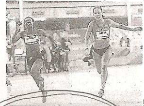
pages 2 et 20

Athlétisme L'Ouest a tiré son épingle du jeu à Aubière